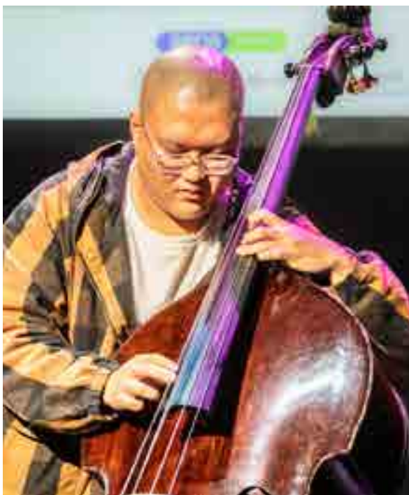
Een jazz student van Conservatorium van Amsterdam