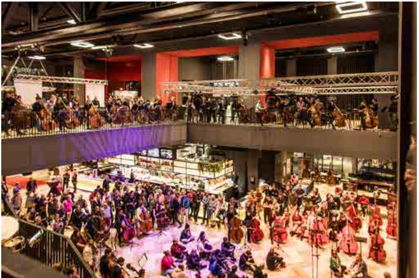
Theater Zuidplein tijdens Music for Bases (Black Lotus) [Festival editie 2023]

Voor een duurzaam bestaan van het festival is het belangrijk dat de organisatie meer lucht krijgt. Om het festival langdurig op hoog niveau te kunnen leiden moeten Oesi & Soomer (en/of ooit hun opvolgers) tijd kunnen vrijmaken om te investeren in onderzoek, voorbereidingen, overleg, in het aangaan van nieuwe samenwerkingen en het ontwikkelen van (ver)nieuwe plannen. Er moet ruimte zijn om specifieke expertises te consulteren - zoals op marketing en productie gebied. Maar ook ruimte om onze mensen marktconform te betalen voor het aantal uren dat ze maken. In het verleden hebben sommige medewerkers uit liefde voor het festival minder uren in rekening gebracht dan daadwerkelijk gemaakt. Daarnaast vinden we het belangrijk om nieuwe expertise aan te trekken op het gebied van educatie & community en sponsoring/werving van derde geldstromen. Daarmee denken we ook een vliegwiel te kunnen creëren waardoor het festival op langere termijn meer eigen fondsen kan binnenbrengen. We vragen in dit plan om ruimere middelen, maar we willen daarbij meteen aangeven dat wij het van belang blijven vinden om efficiënt te blijven werken in een doelgerichte organisatie. Het merendeel van de financiering moet bestemd blijven voor het creëren van de kunst op ons festival.