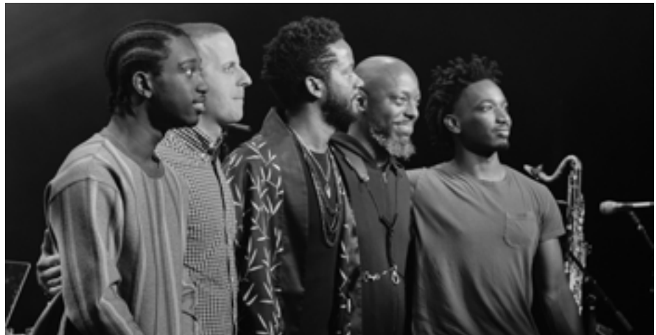
bassist Ben Williams met zijn band op DDBF 2021

Dutch Double Bass Festival (DDBF) is het tweedaagse muziekfestival dat draait om de contrabas en zijn naaste verwanten: de basgitaar (die is voortgekomen uit de contrabas) en de violone & viola da gamba (de historische voorlopers van de moderne contrabas). Aangezien deze instrumenten essentieel zijn in bijna alle muziekgenres, biedt het festival een breed scala aan muziekstijlen, zorgvuldig samengesteld en door elkaar heen geprogrammeerd. In één weekend op één locatie meer dan 15 concerten, Q&A's, een tentoonstelling, een mini-bioscoop met films over de bas, tentoonstellingen van instrumentenmakers en andere randprogrammering rondom de (contra)bas - met stijlen van klassiek naar jazz tot global, hiphop en pop. Deze manier van programmeren creëert een unieke gelegenheid waar verschillende publieksgroepen met elkaar (en elkaars muziek) in contact komen die normaal gesproken niet zo snel met elkaar in aanraking komen: fans van wereldmuziek genieten van klassieke kamermuziek, liefhebbers van klassieke muziek ontdekken jazz, avant-garde en popmuziek, terwijl popmuziek fans zich laten betoveren door oude muziek. Deze diversiteit van muziekstijlen zorgt voor een bijzondere sfeer van verbinding en ontdekking tussen publieksgroepen en musici, dat in de eerste vier edities van DDBF zo kenmerkend is geworden voor het evenement.