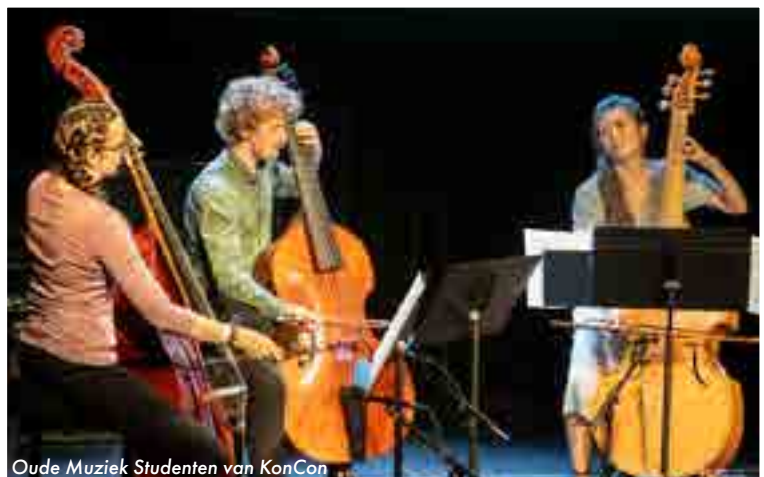
Oude Muziek Studenten van KonCon